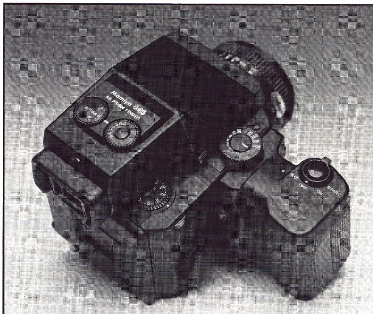
Motor og AE-prismesøger forvandler 645 SUPER til et ideelt reportagekamera. Kameraet ligger perfekt i hånden og alle knapper er anbragt grebvenligt og overskueligt.