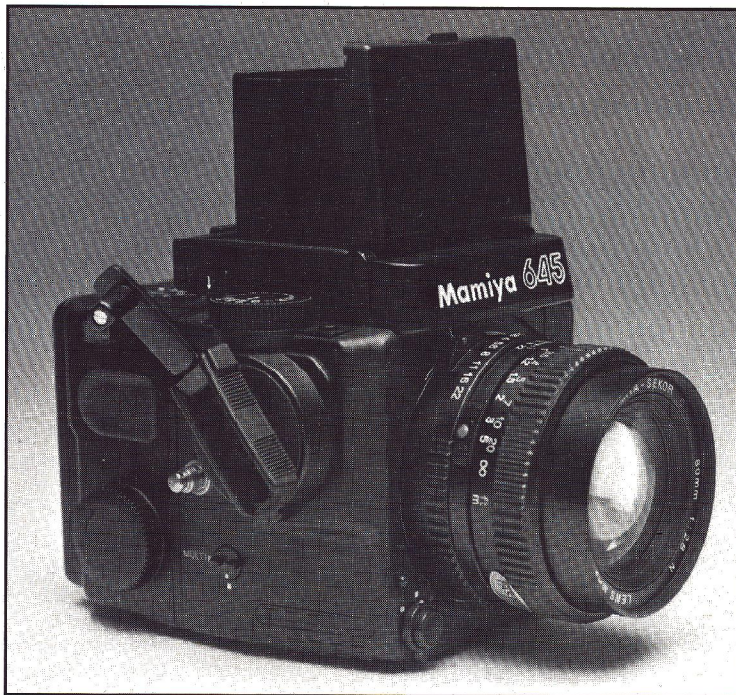
Grundmodellen med en glimrende skaktsøger og et fremragende normalobjektiv er bedst, når man i ro og mag vil komponere billedet på matskiven.

Zenza Bronica 645 minder i mangt og meget om Mamiyaen. Den afgørende forskel ligger i, at Bronica har centrallukker indbygget i samtlige objektiver. Det giver flashsynkronisering på alle lukkertider. Til gengæld må man leve med en gennemgående lavere lysstyrke. Prisforskellen på de to kameraer er beskednen, men